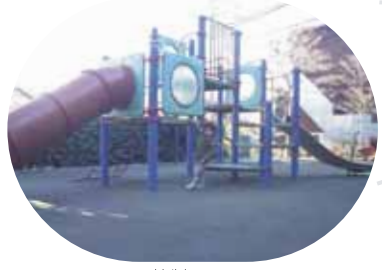
よしやま 葦山公園