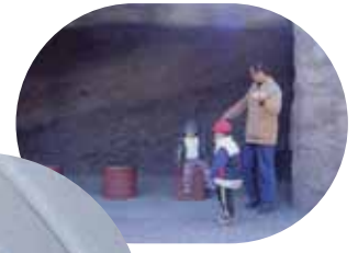
大森貝塚遺跡庭園