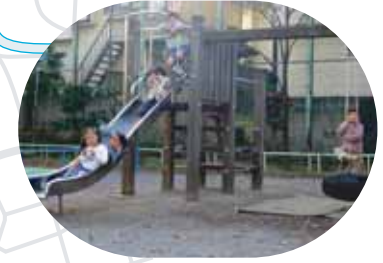
いずるし 出石公園