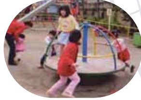
富士見ヶ丘児童遊園